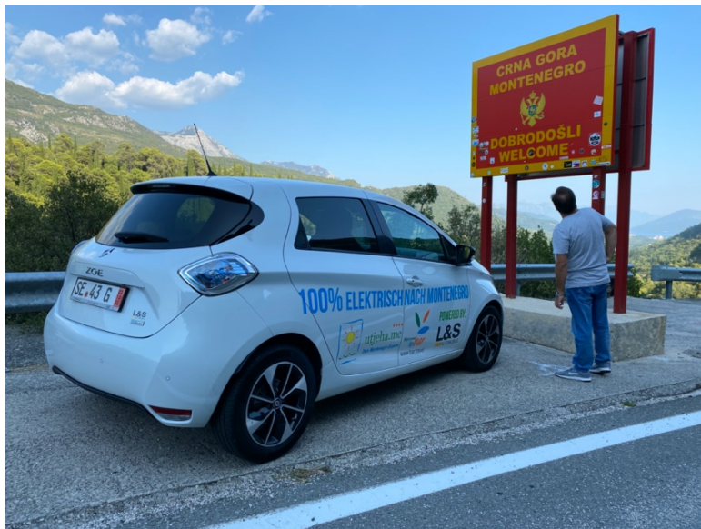
Ziel erreicht: Michael Bader ist nach über zweitausend Kilometern mit dem Elektroauto in Montenegro angekommen.

Mit dem Elektroauto sind Urlaubsreisen ans Mittelmeer möglich.